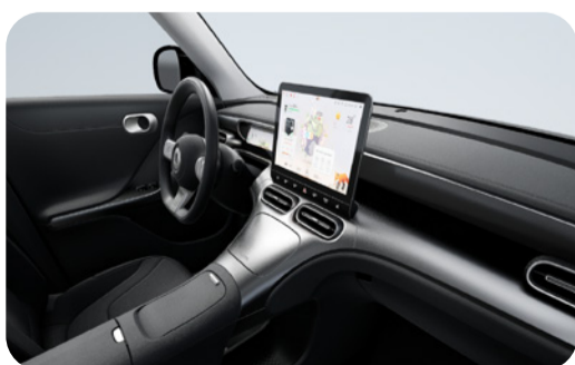
Meteorite Black Disponible en #1 Pure