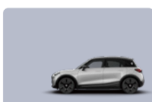
Cyber Silver / Black