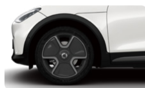
19" Amps 235/45 R19 Disponible en #1 Pro+