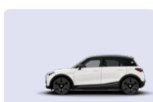
Digital White / Black