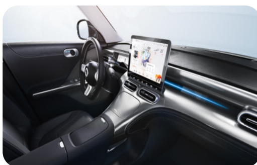
After Dark Disponible en #1 Pro+