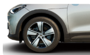
18" Spark 235/50 R18 Disponible en #1 Pure