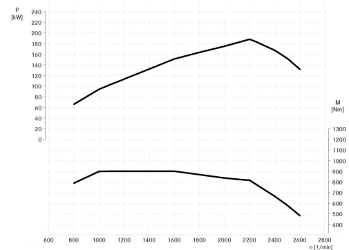
Curva de motor: OM 926